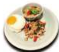
ガバオ&グリーンカレー スペシャルランチ 🍷🍷 Gapao & Green Curry Special Lunch +200 yen