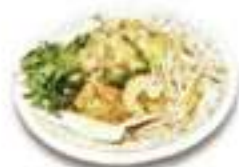
海鮮焼きビーフン パッタイ Pad Thai