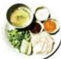
数量限定 海南チキンライス Hainanese Chicken Rice