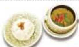
グリーンカレー 🍷🍷 Green Curry