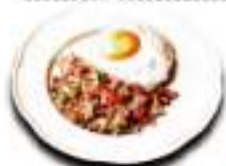
鶏肉のガバオライス 🍷 Gapao Rice