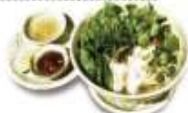
比内地鶏のフォンを使った フォー Pho made broth with Fond de Hinaijidori